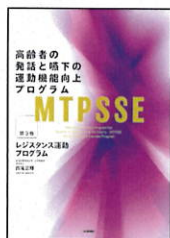
【第3巻】 レジスタンス 運動プログラム