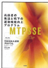
【第2巻】 可動域拡大 運動プログラム