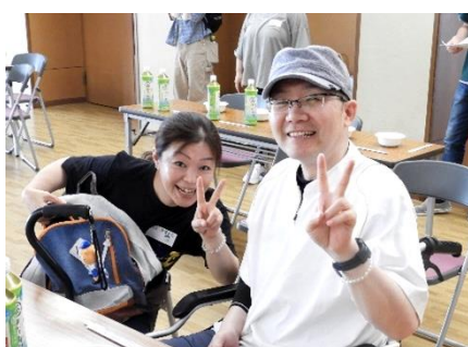
最後は歌を歌い、にぎやかに閉会となりました。野菜や桃の差し入れ、どうもありがとうございました。