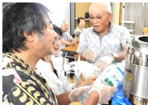
そうめんを流す係にも挑戦しました！