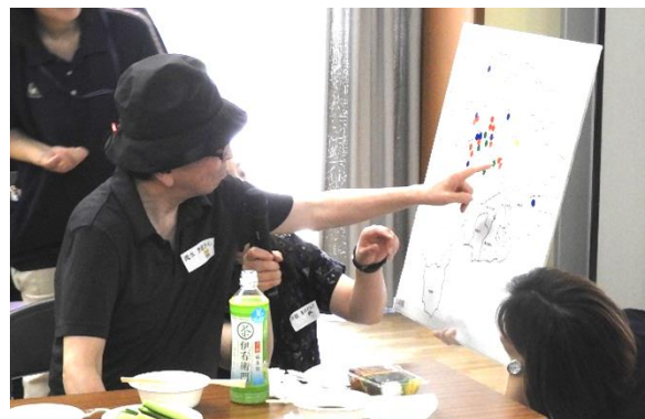
初めてのご参加、自己紹介です！